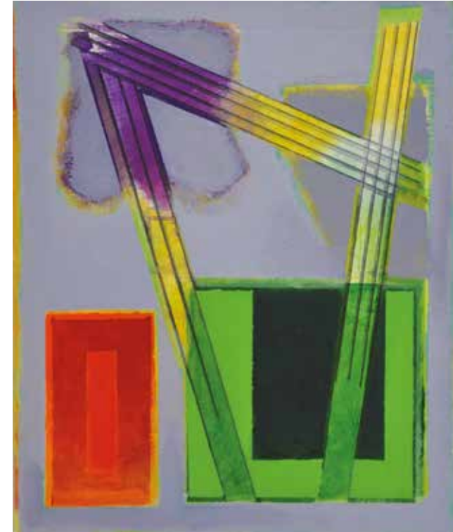
Resonance ▲ Acrylic on canvas on board 30x25 cm 2019