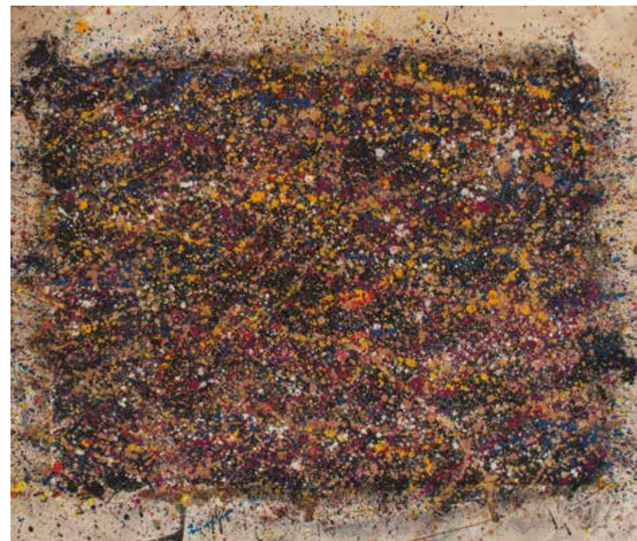
Improvizations - Sonic Landscape 2 ▲ Acrylic polymer paint, paper, canvas 105 x 89 cm 2020