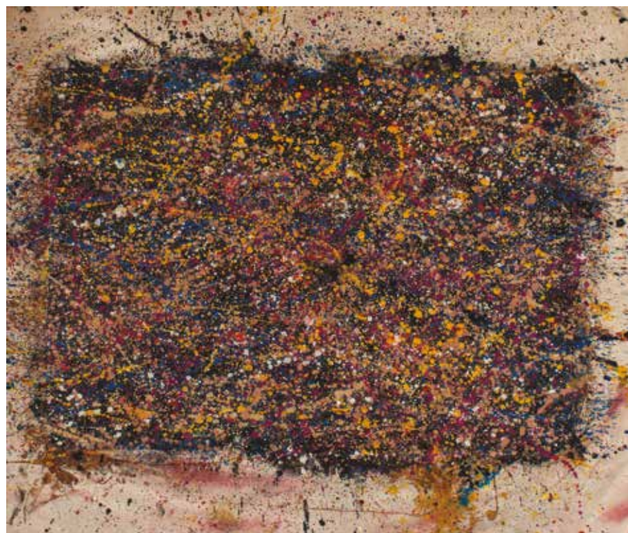
Improvizations - Sonic Landscape 1 ▲ Acrylic polymer paint, paper, canvas 105 x 89 cm 2020