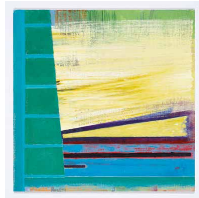
Resonance ▲ Acrylic on canvas on board 30 x 30 cm 2019