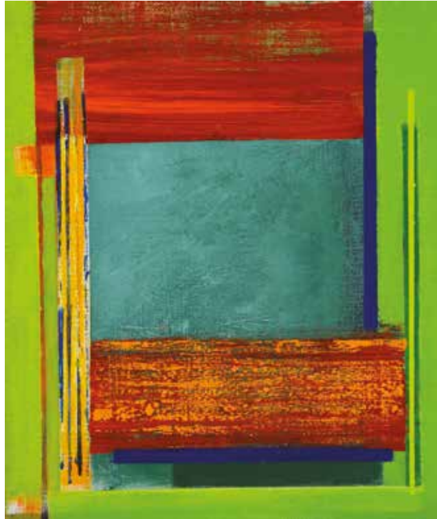
Resonance ▲ Acrylic on canvas on board 30 x 25 cm 2019