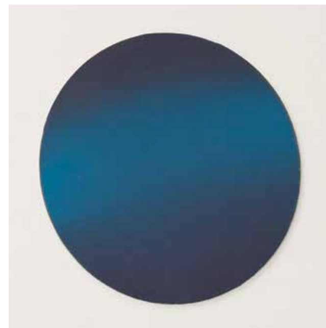
Silence in a Drop of Blue 4 ▲ Acrylic on wood 25 x 25 cm 2020