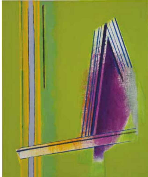
Resonance ▲ Acrylic on canvas on board 30x25 cm 2019