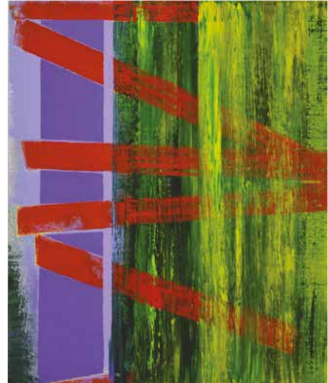
Resonance ▲ Acrylic on canvas on board 30 x 25 cm 2019