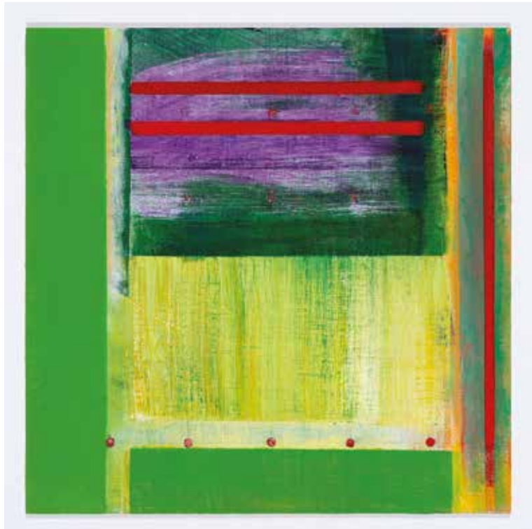
Resonance ▲ Acrylic on canvas on board 30 x 30 cm 2019