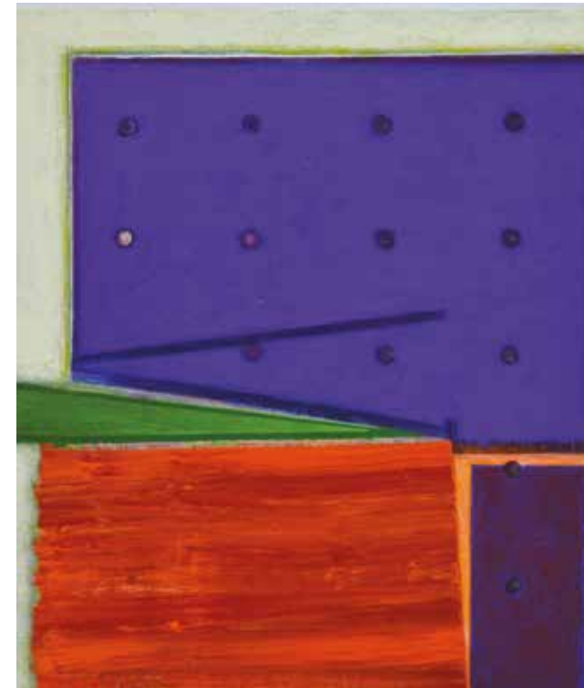
Resonance ▲ Acrylic on canvas on board 30 x 25 cm 2019