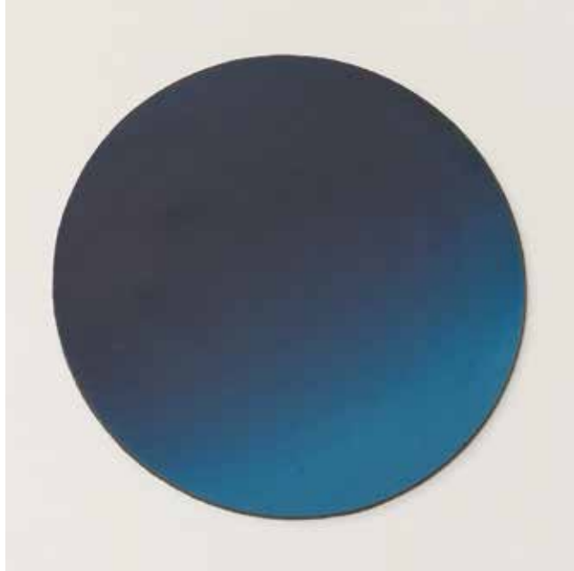
Silence in a Drop of Blue 1 ▲ Acrylic on wood 25 x 25 cm 2020