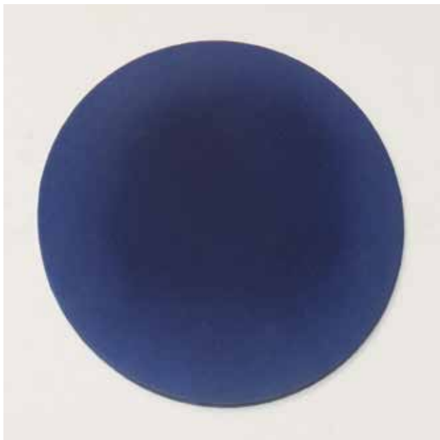
Silence in a Drop of Blue 6 ▲ Acrylic on wood 25 x 25 cm 2020

© Abstract Project 5, rue des Immeubles-Industriels 75011 Paris contact@abstract-project.com Édition Abstract Project Création Delnau