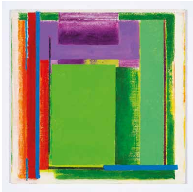
Resonance ▲ Acrylic on canvas on board 30 x 30 cm 2019