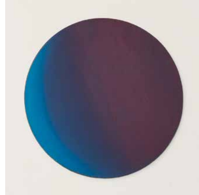
Silence in a Drop of Blue 2 ▲ Acrylic on wood 25 x 25 cm 2020